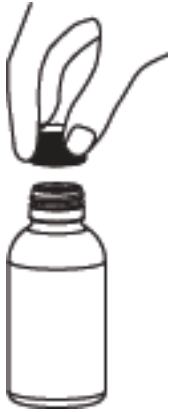
1-ABİZOL 1 mg/ml oral çözelti şişesinin kapağı açılır.