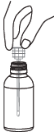
2-Önce enjektörün adaptörü şişeye oturtulur.