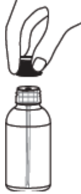
5-Dolu enjektör şişeden ayrılır, sonraki kullanımlarda kolaylık için adaptör şişe üzerinde bırakılır.

Kendinizi daha iyi hissetseniz bile, öncelikle doktorunuza danışmadan ABİZOL günlük dozunu değiştirmeyiniz ya da kesmeyiniz.