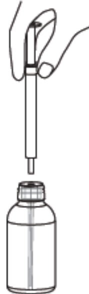
3-Sonra enjektör yerleştirilir.