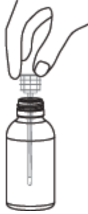
2-Önce enjektörün adaptörü şişeye oturtulur.