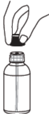
5-Dolu enjektör şişeden ayrılır, sonraki kullanımlarda kolaylık için adaptör şişe

Kendinizi daha iyi hissetseniz bile, öncelikle doktorunuza danışmadan ABİZOL günlük dozunu değiştirmeyiniz ya da kesmeyiniz.